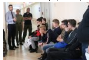
Młodzież z wizytą w urzędzie #6