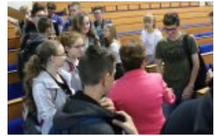
Młodzież z wizytą w urzędzie #9