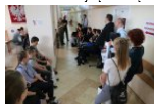
Młodzież z wizytą w urzędzie #7