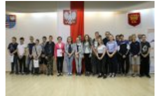
Młodzież z wizytą w urzędzie #1