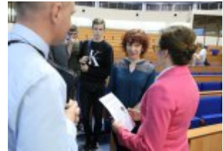
Młodzież z wizytą w urzędzie #8