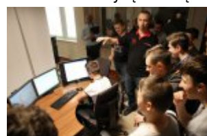
Młodzież z wizytą w urzędzie #4