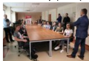
Młodzież z wizytą w urzędzie #2